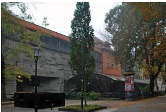
Галерия „Бункер на изкуството, Краков, изт.: Wikimedia

„Божествена комедия” обаче не представя само полския театър. От година на година фестивалът посреща философи, теоретици, журналисти и критици, които се включват като специалисти и дискусанти в панелите на съпътстващата програма. Фестивалният център в Бункера на изкуството всяка година се превръща в място за срещи и дискусии на театралните дейци, където може да се почувства пулсът на съвременния театър. Именно дискусията и диалогът са ключови за идеята, залегнала в основата на фестивала. В рамките на „Божествена комедия” важи принципът, че срещата на естетики и творческата конфронтация винаги трябва да бъдат съпътствани от взаимно уважение и желание за опознаване на различни гледни точки.