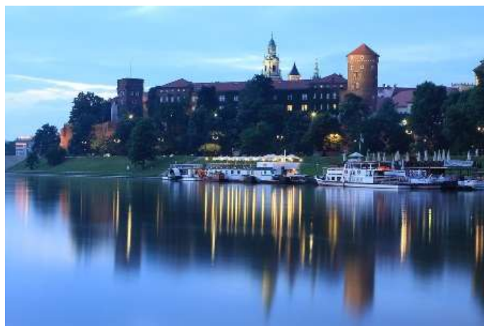
Вавел откъм р. Висла, източник: fotopolska.pot.gov.pl

Днес най-голямата атракция на Краков е хълмът над Висла с Кралския дворец, Катедралата и пещерата на дракона Смок. Величественият замък се издига на Вавелския хълм като паметник на историята и архитектурата и като съкровищница, събрала произведения на изкуството и символи на националната памет. До края на XVI век той е резиденция на полските владетели, а днес – музей. Постоянната експозиция обхваща представителни колекции, личните кралски покои, съкровищница и оръжейна. От тавана на голямата зала, наречена Поселска (Парламентарна), към посетителите гледат изваяни глави, представлящи 30 оригинални портрета на полското общество от епохата на ренесанса. Това великолепно дело на изобразителното изкуство впечатлява с изключителното внимание към детайла. Най-ценна е колекцията от тъкани завеси от XVI век, които представят библейски сцени. На някои от тях са извезани гербовете на Полша и Литва.