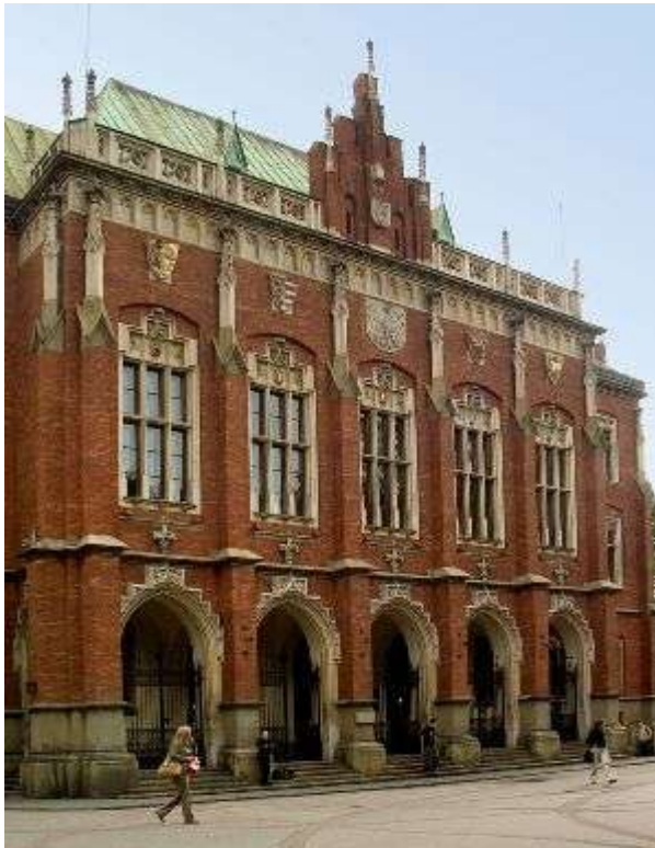
Collegium Novum

След възстановяването на независимостта през 1918 г. Краковският университет се превръща в едно от най-важните учебни заведения. В него се развиват хуманитарните и точните науки, построена е сградата на Ягелонската библиотека. В началото на Втората световна война, на 6 ноември 1939 г., германските окупационни власти арестуват и изпращат в концентрационни лагери почти 180 преподаватели, а университетът е закрит. От 1942 г. той функционира нелегално и дава образование на около 800 студенти, сред които е и Карол Войтила, бъдещият папа Йоан Павел II. След края на войната Краков привлича учени, които напускат Лвов и Вилнюс след промяната на източната полска граница. Студенти и преподаватели участват в демонстрациите срещу комунистическата власт през 1968 и 1981 г.