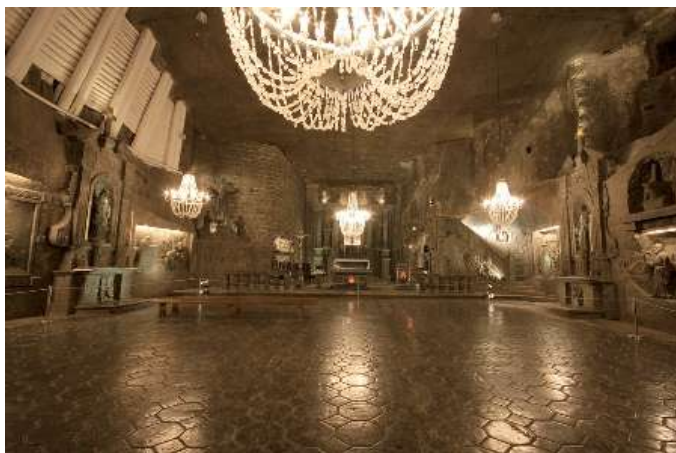
Солната мина във Величка

Солната мина във Величка е един от първите обекти в света, вписани в Списъка на световното наследство на ЮНЕСКО. Тя има необикновен микроклимат, а тунелите ѝ са украсени с удивителни скулптури от сол. Тези произведения на изкуството, наред с издълбаните в скалата параклиси са свидетелство за богатата духовност на миньорите. Умореният турист може да се наслади на спа-процедури, новаторски лечебни практики, а специално устроени камери предлагат дори възможност за една магична нощ в солната мина. За любителите на силни усещания Величка предлага неповторимо предложение: пътуване с лодка по залятите с вода канали на мината. Мината в Бохня се предлага пътуване във времето с помощта на мултимедийна експозиция, която представя развитието на миньорските техники през вековете.