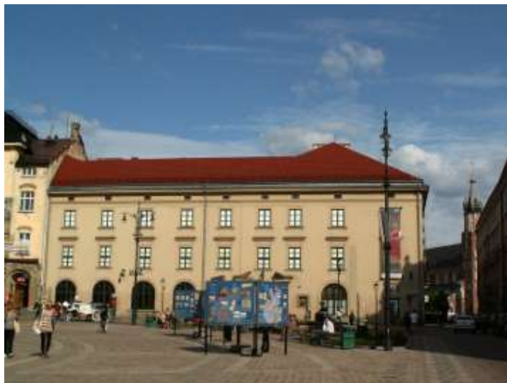
Пл. Шчепански, Краков, изт.: Wikimedia

Естествената красота на полските пейзажи привлича с магична, дори приказна атмосфера. Полската природа се превръща в отличен, богат и разнообразен натурален декор за игрални филми. Тук има всичко: равнини, възвишения, планини, гори, поля и езера. Със смяната на годишните времена се променя и пейзажът – зелената пролет, златното лято, пъстроцветната есен и снежната зима. Със своята магия изкушават тайнствени горски кътчета, езера в диво, сякаш недокоснато от човешка ръка обкръжение, ниски хълмове, покрити с жита, руини от средновековни замъци сред белите скали на Краковско-Ченстоховската Юра и наглед недостъпните, остри върхове на Татрите. Краков се превръща в мащабен декор за шедевъра на Стивън Спилбърг „Списъкът на Шиндлер”.