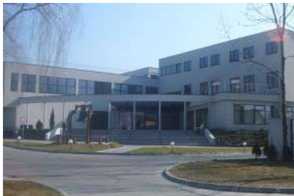
National-Louis University в Нови Сонч

образованието в 7 ключови за воеводството бранша: механика, строителство, информатика и електроника, туризъм и гастрономия, селско стопанство и лека промишленост, социално-медицинско обслужване, услуги. Партньори са Министерство на земеделието, канцеларията на областния управител и неправителствени организации. За учениците се осигуряват специализирани занятия за повишаване на професионалната компетенция и консултации в областта на образователните перспективи и възможностите за реализация. Друга важна инициатива е „Малополски образователен облак”, иновативен проект за популяризиране сред учениците на знанията и научните постижения на висшите учебни заведения посредством информационни и телекомуникационни технологии. В рамките на проекта се осигурява необходимата техника и се провеждат специализирани занятия в техникуми и лицеи.