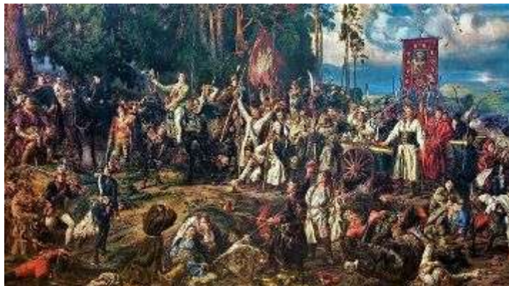
Ян Матейко, „Кошчущко при Рацлавице”, изт.: Wikimedia

Краков не е най-старият град в Полша, но е един от най-красивите. Корените на Малополша обаче са още по-дълбоки, както показват проучванията на студентите от Историческия факултет на Ягелонския университет на Гура Зиндарма (Планината на Зиндарм). Названието идва от името на полския рицар Зиндарм, чийто брат участва в битката при Грюнвалд.