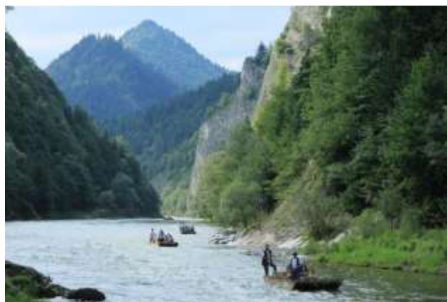
Проломът на р. Дунайец

Това е едно от най-красивите трасета в Европа. Пенините са район на варовикови скали, гъсти гори и живописни ливади. През тях преминава Дунайец, буйна река, която се вие между стръмните скали и оформя седем меандри с резки завои. В най-тесния участък ширината на пролома е 100 м. Течението е променливо, а дълбочината на коритото достига до 10 метра. В по-дълбоките места водата се успокоява, а в плитчините се разпенва. Най-ефектната стена Соколица се издига отвесно на 300 метра над Дунайец. По време на „Лудата езда по Дунайец“ по примера на прадедите тесни лодки се привързват една за друга, така че да оформят сал. На носа се слагат смърчови клонки, които да предпазват от водата. Салджии, облечени в местни носии, ловко маневрират в буйната река.