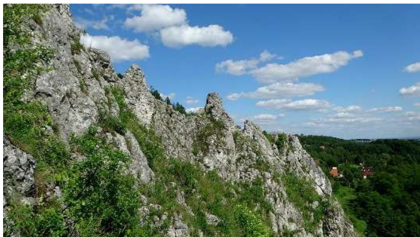
Краковско-Ченстоховската Юра

замък в региона и обвитата в мрачни легенди Пещера на крал Локетек. Интересни образувания се наблюдават в пещерите Вежховска Гура и Нетопежова (Прилепова). Символът на Юра е характерното скално образувание Боздуганът на Херкулес с височина 25 м. На много места се провеждат спортни състезания и се организират туристически атракции като рицарския турнир в Огородженец – най-