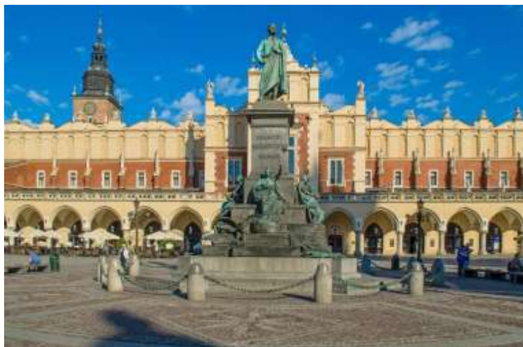
Паметникът на Адам Мицкевич в Краков

Фестивалът Милош е ежегоден празник на поезията, най-мащабното по рода си събитие в Полша и Централна Европа. Всяко издание се посещава от най-големите звезди на световната литература. Фестивалът се заражда като продължение на Краковските срещи на поетите от Изтока и Запада, организирани през 1997 и 2000 година от нобеловите лауреати Вислава Шимборска и Чеслав Милош. Пет години след смъртта на Милош Институтът на книгата организира първото му издание под заглавие Поробеният разум .