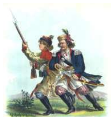
Краковски гренадири, изт.: Wikimedia

Населението, което изследователите определят като Източни краковяни, заема земеделските райони на юг и изток от някогашната полска столица, главно по левия бряг на Висла. Центрове на този регион са: Домброва Тарновска, Пинчув, Прошовице и Бжеско. Западните земеделско-промишлени райони, които днес често са квартали на Краков, се населяват от западните краковяни. Именно те носят най-известната полска народна носия. През XIX в. тя започва да се възприема като национална във връзка с въстанието на Кошчушко (1794 г.). Тогава водачът на бунта избира краковските кафтани, за да отличи победителите при Рацлавице. Кафтанът и типичната шапка (рогативка) след загубата на независимостта се превръщат в своеобразна военна униформа, използвана както на територията на Полша, така и извън нея. Типичен елемент от женската носия е късият корсет със сапфирен, винен, виолетов, зелен или черен цвят, ушит от вълна, кадифе, брокат или копринено кадифе. Той се отличава с богатата си украса, която заема почти цялата му повърхност. За изработката ѝ се използват най-често червени копчета, мъниста и пайети, метални или копринени лентички, панделки, пискюли, допълнени от плоска бродерия с растителни мотиви. Важен акцент в краковската носия е герданът от корали.