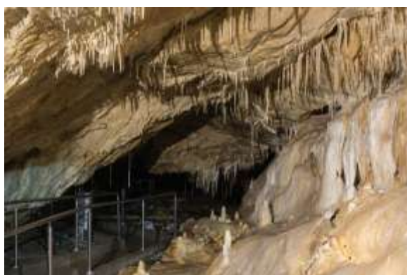
Мечата пещера, изт.: Wikimedia

Тази пещера в Судетите впечатлява с невероятно богатия си и живописен релеф. Никъде другаде не се откриват толкова много останки от пещерни животни, както тук. Никоя друга полска пещера не може да се похвали с толкова красиви сталактити и сталагмити, а коридорите са осеяни с кости на изчезнали животински видове, безценен материал за палеонтологически изследвания. Тук е и най-голямата в Европа подземна камера. Залата на мастодонта е толкова голяма, че в нея може да се вмести десететажна сграда или футболен стадион. За посетители е отворен централният сектор с дължина 400 м. Във входния павилион е представен животът на праисторическите животни. Най-многобройни сред откритите в пещерата останки са тези на мечките. Наред с тях са намерени пещерен лъв, пещерна хиена, вълк, белка, няколко вида прилепи, бобър, сърна, глиган, лисица и много гризачи.