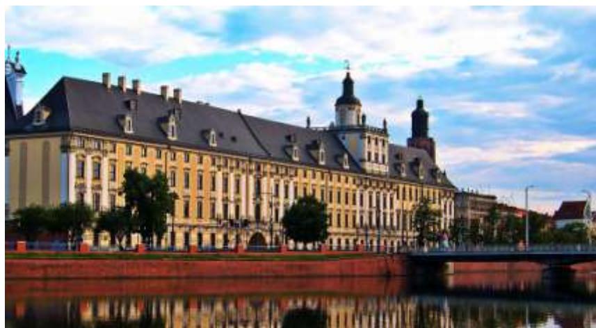
Централната сграда на Вроцлавския университет, изт.: Wikimedia.

Висшето училище в града се появява благодарение на йезуитския орден и