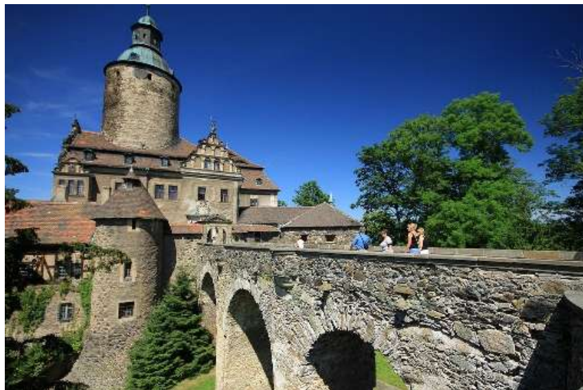
Замъкът Чоха

Замъкът е издигнат през XIII век като укрепление. След бурните векове и пожарите, които през XVIII век унищожават сградата, с цената на големи разходи паметникът си възвръща някогашната слава. Благодарение на това замъкът става една от най-интересните атракции на Долен Шльонск. За съжаление, в периода след Втората световна война почти цялото му имущество е откраднато. Сега във впечатляващия монументален замък се