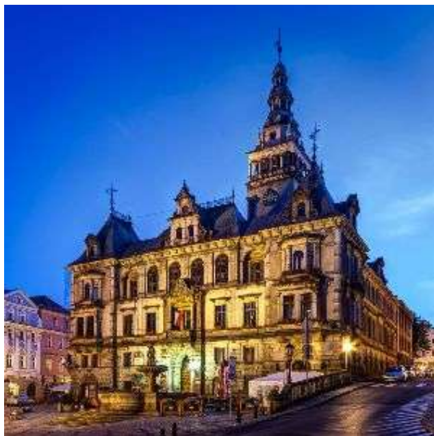
Кметството в Клодзко

През X век на терена на днешния град се намира чешко укрепено селище – Кладско, разположено на пътя от Прага за Вроцлав. То е споменато за пръв път през 981 година. През втората половина на XI и XIII век Клодзко е под властта на Пястите. Градски права получава преди 1223 година. Период на разцвет за града е XIV – XVI в. Тогава се развиват търговията и монетосеченето, а Клодзко се превръща в център на занаятите, като водещо е шивачеството.