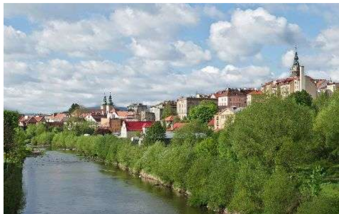
Клодзко, изт.: Wikimedia

Присъединяването към Германската империя е свързано с превръщането на Клодзко в укрепена крепост. По-голямата част от сградите в града са планирани според развитието на крепостните стени и укрепления, като по този начин се формират многобройни бастиони. В края на XIX в. в Клодзко е открит голям железопътен възел и се развива металообработващата промишленост, дървообработката и производството на керамика. По време на Втората световна война на територията на града функционира трудов лагер, във военните затвори са държани съветски, френски и италиански