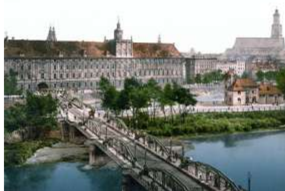
Вроцлавският университет през XIX век

След като Шльонск става част от Прусия, крал Фридрих II гарантира съществуването на университета, но не е доволен от равнището на обучението, което не покрива изискванията от епохата на Просвещението. Йезуитското училище не се