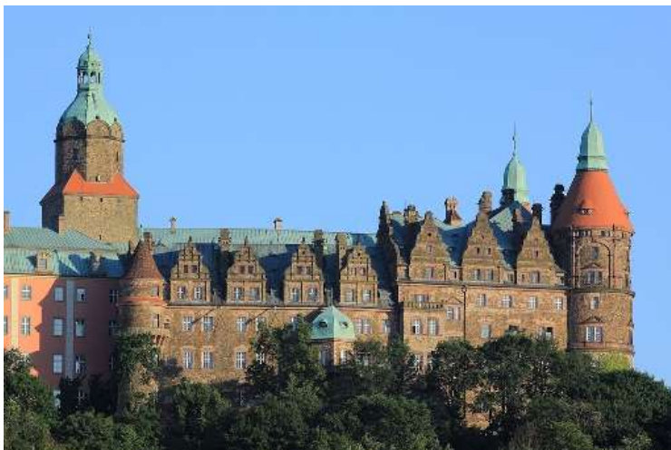
Кшъонж, изт.: fotopolska.pot.gov.pl

Градините на замъка впечатляват със старателно аранжираните цветни лехи. Залата на Максимилиан и апартаментът на княгиня Дейзи разкриват пищни барокови интериори. Дейзи е една от най-интересните фигури, свързани с историята на обекта, жена, която заплънява съвременниците си с необикновена красота и пацифистични убеждения