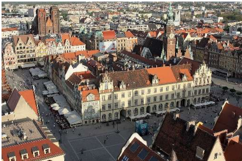
Острув Тумски

През 1526 година Шльонск попада под властта на Хабсбургите и губи своето икономическо значение. През 1675 г. умира последният представител на шльонските Пясти, Йежи Вилхелм. През XVIII в. след войните на Прусия с Австрия, по силата на договорите от 1742 и 1763 г., основната част от Шльонск (без Чешински и Карнъовско-Опавски Шльонск) попада в рамките на пруската държава. Въпреки масовата германизация в началото на XIX в. Горен Шльонск и дясното крайбрежие на Долен Шльонск, както и околностите на Вроцлав и Олава имат решително полски характер.