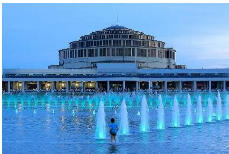
Залата на столетието, Вроцлав

на металургичния завод в Легница, през 1957 г. е открита медна руда в околностите на Любин и Полковице. През 1961 г. е отворен Комбинатът за добив и преработка на мед, който обслужва и двете находища. Фирмата съществува и до днес и е едно от най-успешните държавни предприятия.