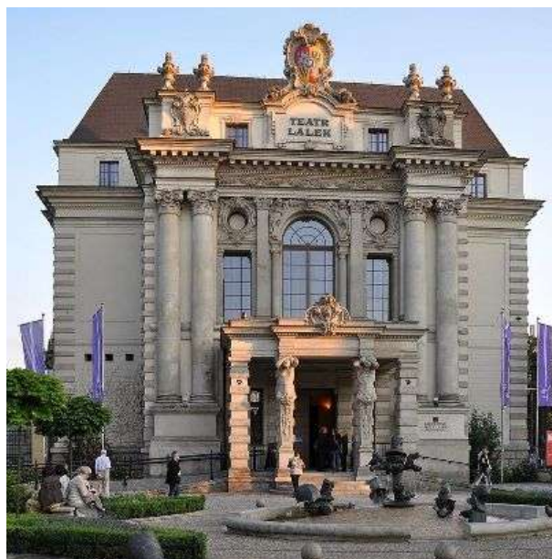
Кукленият театър във Вроцлав

Сред театралните предложения на Европейска столица на културата се откроява Театралната олимпиада, проведена под мотото „Светът – място на истината”. В нея са