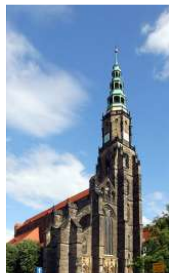
Катедралата „Св. Станислав и св. Вацлав” в Швидница

Площадът в Швидница е един от най-ценните и красиви в Долен Шльонск. Сградите около него са в различен стил – от ренесанс до сецесион. През XIII век той е място на търговия, а до ден днешен в първата неделя от месеца се организира антикварен пазар. Някога кметството се е отличавало със своята красива кула, която, за