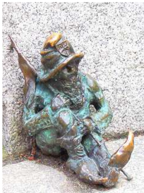
Вроцлав, изт.: Wikimedia

През 2016 г. във Вроцлав отваря врати специален музей, посветен на националната епопея „Пан Тадеуш” от Адам Мицкевич. Мащабен проект в сферата на литературата е „Библиополис. Град на библиотеки”, който прави художествените текстове част от градската среда. В столицата на Долен Шльонск ще се проведе Международният фестивал за