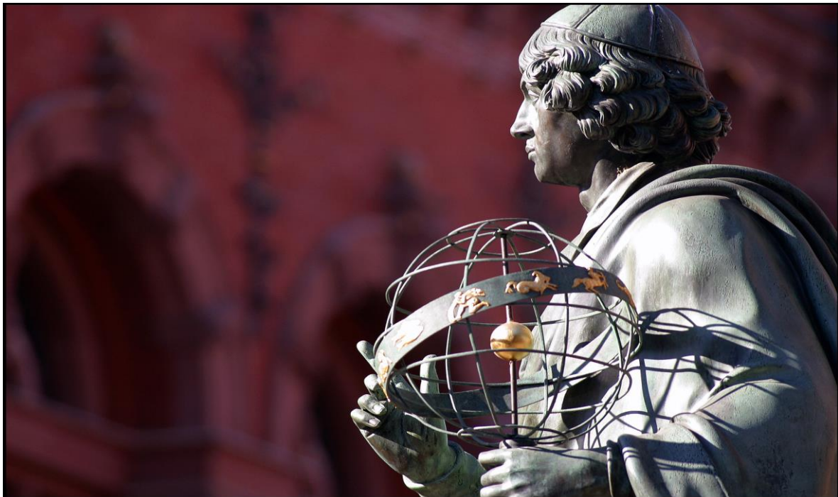
Паметникът на Коперник

Ренесансът и барокът също оставят своите знаци. Следи от Ренесанса носят фасадите