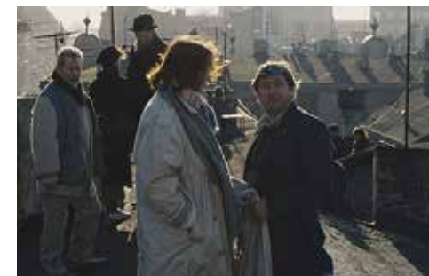
кадър от филма